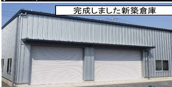
完成しました新築倉庫

北本建設はyessを推します！yess建築の魅力お伝え致します！低価格、短工期、高品質！意匠性に優れフレキシブルな、目的や用途に応じたオーダーメイド感覚のシステム建築です。当社で建てさせて頂きました倉庫です。