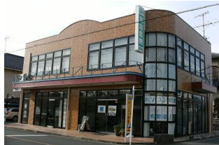
外壁コーティング