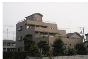
重量鉄骨構造(二世帯住宅)